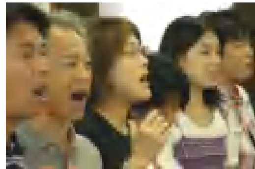
ゴスペルクワイヤー